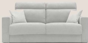
196 mat. 140x197