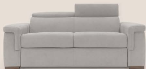
200 mat. 120x197